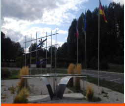
Table d'observation de Muizon — MUIZON