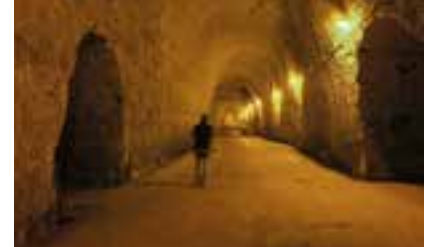
Les crayères des caves de Jean-Benoît Héry à Châlons-en-Champagne.

Sous nos pieds, reposent également des millions de bouteilles de champagne, disposées dans les crayères champenoises - ces anciennes carrières souterraines d'où étaient extraits les blocs de craie utilisés pour la construction. Elles garantissent l'obscurité, une température constante autour de 10/11°, une hygrométrie indispensable à l'élaboration du champagne. Installé à Châlons-en-Champagne depuis 2019, Jean-Benoît Héry (champagne J.B Héry) évoque volontiers « l'émotion qu'il y a à parcourir à pas feutrés » ces galeries (sous une voûte de 8 m de hauteur pour les siennes), façonnées voici près de 2 000 ans par le labeur des hommes.