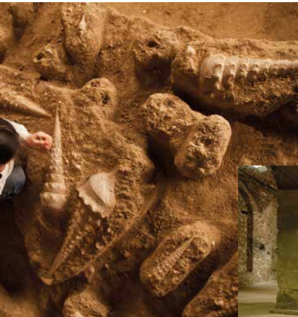
Les crayères des caves de Jean-Benoît Héry à Châlons-en-Champagne.

Environ, comme le nombre d'hypogées que l'on dénombre dans le Département.