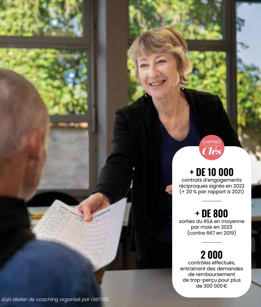
d'un atelier de coaching organisé par l'AEFT151.