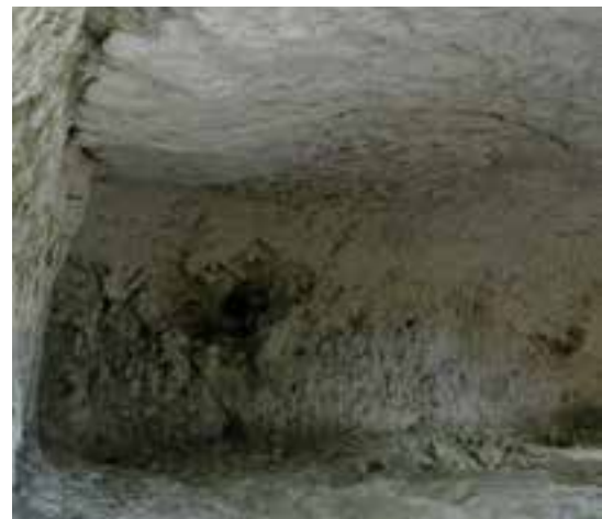
Les hypogées de Villevenard.