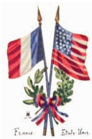
Illustration Armes célébrant l'alliance entre la France et les États-Unis. © Collection privée

RETROUVEZ TOUTE LA PROGRAMMATION SUR WWW.MARNE.FR