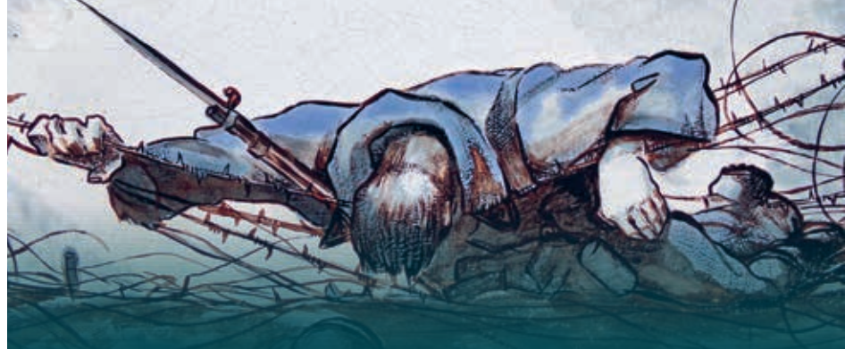
Illustration Peinture sur plaque émaillée, monument Aux héros et martyrs des offensives d'avril 1917.

Par l'association philatélique Sparnacienne.